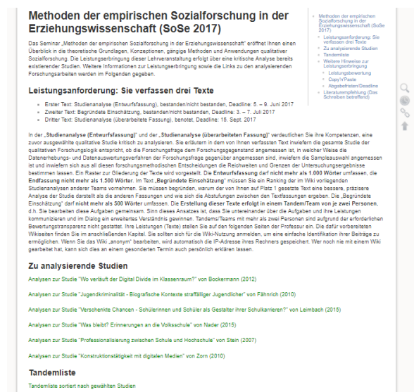
Abb. 2: Ausschnitt der Startseite des DokuWikis mit den Leistungsanforderungen, der Tandemliste und den zu analysierenden Studien

Das Wiki dient im Seminkontext als zentrale Plattform zur selbstständigen Vertiefung bzw. Bearbeitung der im Seminar gestellten Aufgaben. Im Wiki werden organisatorische Aspekte (Links zu den Dissertationen, Einteilung der Studierenden in Tandems, Zuordnung der Tandems zu den Dissertationen) vonseiten der Lehrenden veröffentlicht (siehe Abbildung 2 und Abbildung 3).